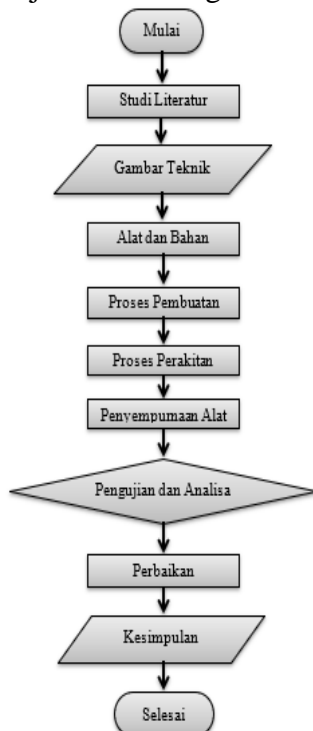
Gambar 1. Diagram Proses Pembuatan

Proses pembuatan alat merupakan suatu kegiatan awal dari suatu rangkaian kegiatan dalam proses produk. Kegiatan yang dilakukan sesuai beberapa tahap sesuai petunjuk dalam diagram alir 1.