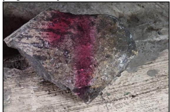
Gambar 3. Sampel kedua untuk Pengujian UCS

Sampel kedua mewakili dari bench lereng 3 dan bench lereng 4, untuk sampel yang kedua dapat dilihat dalam Gambar 3.