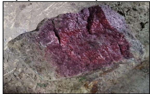
Gambar 2. Sampel Pertama Untuk Pengujian UCS

bench lereng 1 dan bench lereng 2. Untuk sampel pertama bisa dilihat pada Gambar 2.