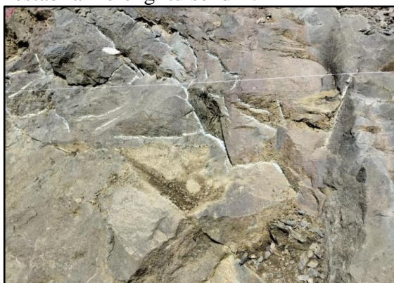
Gambar 1. Material Pembentuk Lereng

Faktor keamanan yang mengacu kepada nilai faktor keamanan yang telah ditentukan dalam Keputusan Menteri ESDM Nomor 1827 K Tahun 2018. meliputi Pengambilan data dengan metode kuantitatif maupun kualitatif. Penelitian ini dilakukan di PT. Gunung Bumi Perkasa, Sukabumi. Pengamatan yang dilakukan secara langsung sehingga dapat mengetahui material pembentuk dari lereng tersebut. Menurut SNI 2436:2008 yang dimana material pembentuk lereng ini bahwa seluruhnya memiliki jenis dan warna yang sama dapat di klasifikasikan ke dalam material jenis struktur Homogen. Material pembentuk lereng dilapangan adalah Batuan Lava Andesitis (Cahyono & Santosa, 2020) dapat dilihat pada Gambar 1. terdapat kekar atau bidang discontinue yang disebabkan oleh pergerakan bumi, sehingga dikarenakan adanya bidang diskontinu tersebut dapat menyebabkan dari kestabilan lereng itu sendiri.